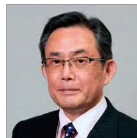
感染対策担当者のための セミナー筆頭講師 東京医療保健大学 名誉教授 平岩病院 院長

病院感染制御のレベルアップのために、関係各所の皆様による多数のご参加をお待ちしております。