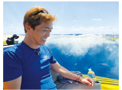
講師 海洋研究開発機構